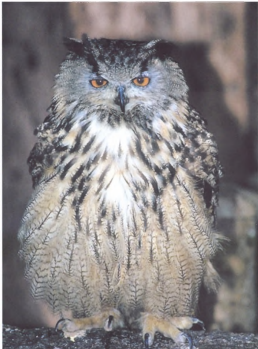
«Пернатая кошка» (ушастая сова)