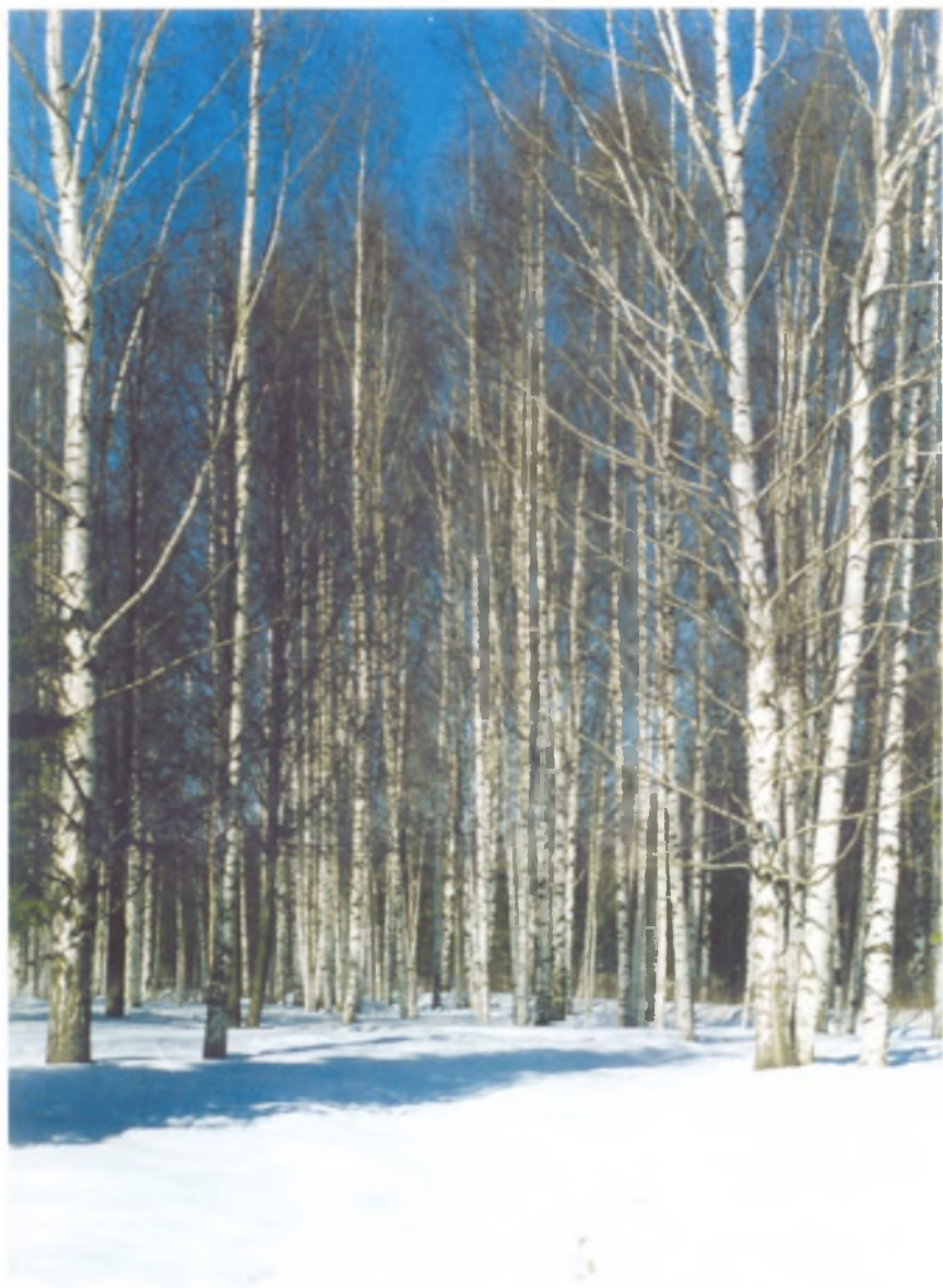
Светлы и красивы белокорые березовые рощицы в любое время года