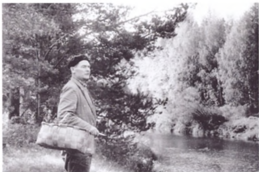
В родных просторах: А.Я. Яшин на берегу реки Юг.