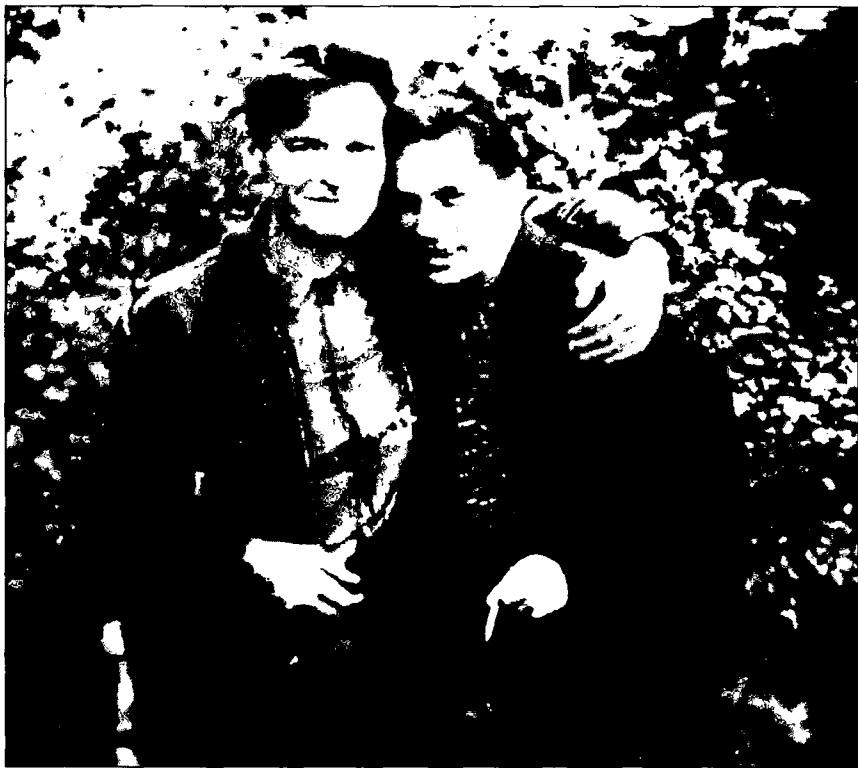
А.Я. Яшин и Ф.А. Абрамов

«Лично для меня привлекает значимость именно уловить красоту, неизъяснимую прелесть народного речения, зафиксировать его, понять», - писал Ф.А. Абрамов.