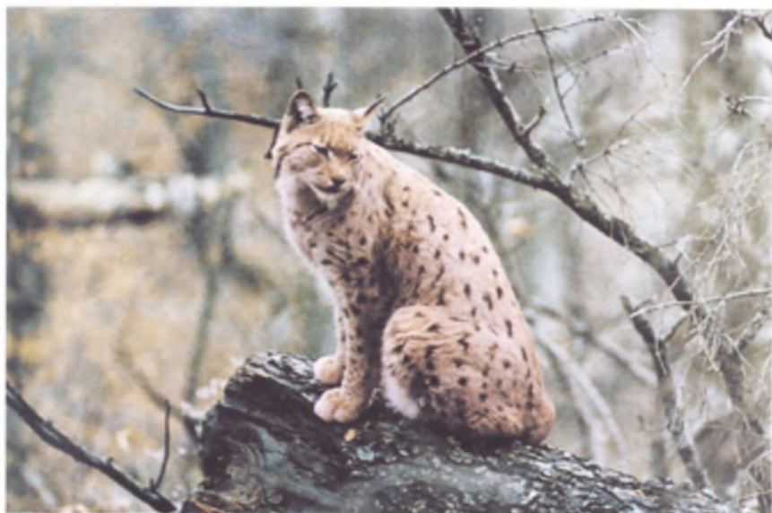
Лесная кошка (рысь)